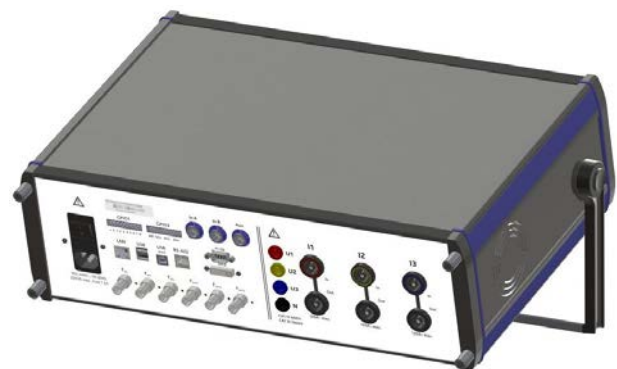
Vista posterior del patrón de referencia RS 3330